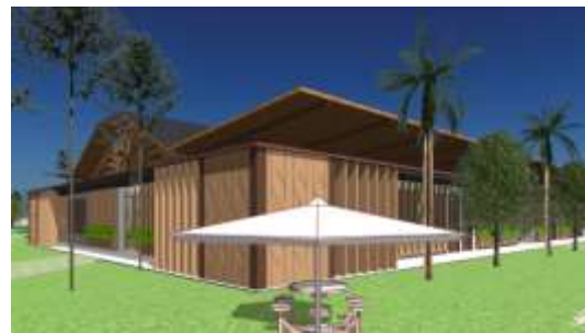
Gambar 17. Eksterior Gedung SMALB