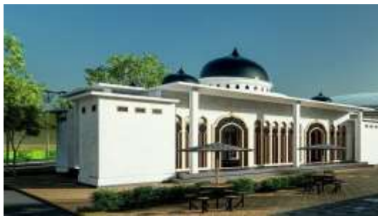
Gambar 21. Eksterior Masjid