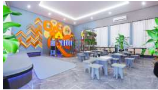
Gambar 14. Konsep Nature of the space

Desain Sekolah Luar Biasa (SLB) C ini, menghadirkan suasana alam didalam setiap ruang dan sudut dalam bangunan. Menciptakan suasana yang membuat perasaan pengguna merasa nyaman dengan view alam yang luas, meningkatkan psikologis anak tunagrahita dalam hal belajar, memberi kesan nyaman dan damai.