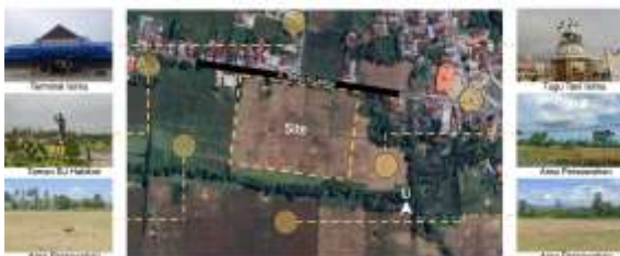
Gambar 3. Batas-Batas Tapak

Tapak Sekolah Luar Biasa (SLB) C berada diarea persawahan, dengan Batasan tapak sebagai berikut.