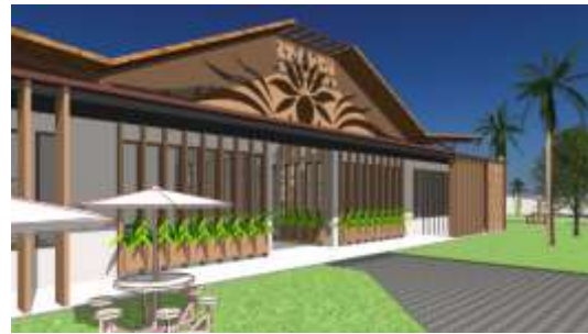
Gambar 15. Eksterior Gedung SDLB