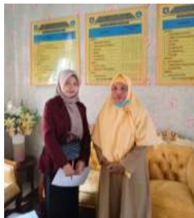
Gambar 1. Wawancara Kepala Sekolah

Berdasarkan hasil wawancara dengan kepala sekolah dan beberapa tenaga pendidik SLB Negeri Bone Bolango, diketahui bahwa sarana dan prasarana, maupun metode pembelajaran yang digunakan masih banyak yang belum memenuhi dan sesuai dengan standar Peraturan Menteri Pendidikan yang dikhususkan untuk siswa Tunagrahita.