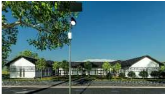
Gambar 20. Eksterior Asrama Siswa