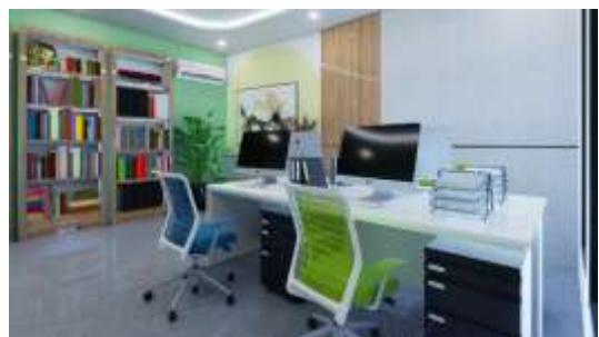
Gambar 27. Interior Ruang Pengelola