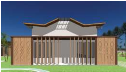
Gambar 19. Eksterior Gedung Aula dan Perpustakaan