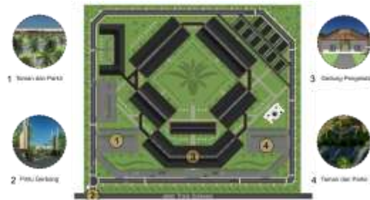
Gambar 4. Konsep Zoning Publik

Zona publik terletak diarea depan dengan pertimbangan menjadi area komunal untuk pengunjung, area yang bebas untuk pengunjung, pengelola maupun siswa dan siswi. Zona Pulik terdiri dari pintu gerbang, pos jaga dan gedung pengelola, serta taman dan parkir.