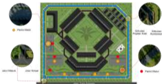
Gambar 8. Konsep Aksesibilitas dan Sirkulasi

Penempatan area parkir juga diletakan di beberapa titik yang berdekatan dengan bangunan, parkir kendaraan terbagi dua, yaitu parkir kendaraan roda dua dan roda empat agar penataan kendaraanya sesuai dan memudahkan pengunjung memarkir kendaraan.