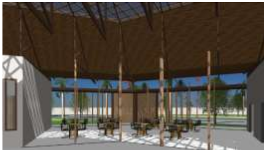
Gambar 12. Konsep Nature in the Space

Pemanfaatan vegetasi temperature udara yang panas, dan sebagai pereduksi arus angin yang panas, digunakan bukaan-bukaan cross ventilation pada bangunan agar sirkulasi angin dapat maksimal keluar masuk bangunan (Octavianti et al., 2018). Memaksimalkan penggunaan cahaya alami melalui atap transparan dan juga bukaan disetiap bangunannya serta penambahan Secondary skin sebagai penghalau intensitas cahaya matahari berlebih (Fahmi et al., 2020).