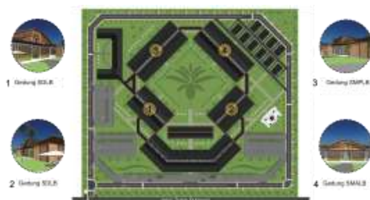
Gambar 6. Konsep Zoning Semi Privat

Zona semi privat terletak diarea tengah belakang, tepat pada area setelah zona semi publik. Aktivitas didalamnya yaitu kegiatan belajar mengajar oleh guru dan juga siswa dengan tingkat SD, SMP, SMA, dengan sarana prasarana yang ada.