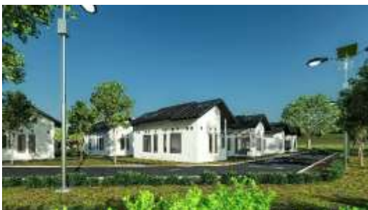
Gambar 22. Eksterior Rumah Dinas