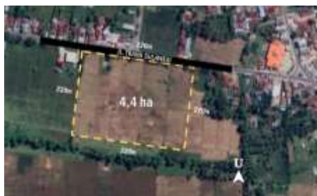
Gambar 2. Lokasi Perancangan

Lokasi perancangan Sekolah Luar Biasa (SLB) C terletak di Jl. Trans Sulawesi, Kecamatan Tibawa, Kabupaten Gorontalo dengan luasan site yakni sekitar + 4,4 ha atau + 44.000 m 2 . Lokasi perancangan dipilih karena kesesuaiannya dengan kriteria-kriteria yang telah dianalisis sebelumnya. Mulai dari kesesuaian Lokasi dengan RTRW Kabupaten Gorontalo sampai dengan utilitas yang sangat baik disekitar site (BPS, 2022).