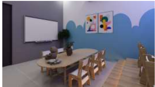
Gambar 25. Interior Ruang Peminatan