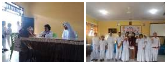
Gambar 1. Wawancara Siswa

Selain itu, dilakukan juga wawancara terhadap beberapa siswa Tunagrahita dan orang tua terkait kegiatan belajar, minat dan bakat serta perilaku dan peran yang mereka lakukan dalam keseharian.