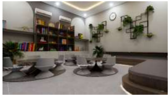
Gambar 24. Interior Ruang Binadiri