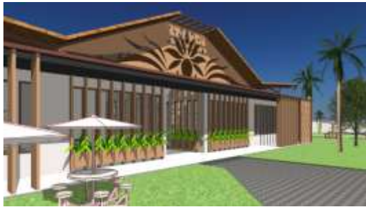
Gambar 11. Konsep Nature in the Space

dapat mereduksi dan meminimalisir panas pada bangunan.