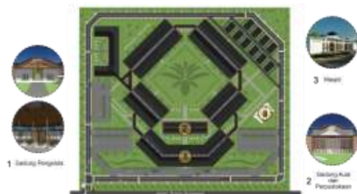
Gambar 5. Konsep Zoning Semi Publik

Zona semi publik terletak diarea tengah depan, tepat pada area setelah zona publik. Aktivitas didalamnya berkaitan dengan administrasi oleh pengelola maupun pengunjung sekolah, dengan sarana prasarana berupa gedung pengelola, gedung aula dan perpustakaan, serta masjid.