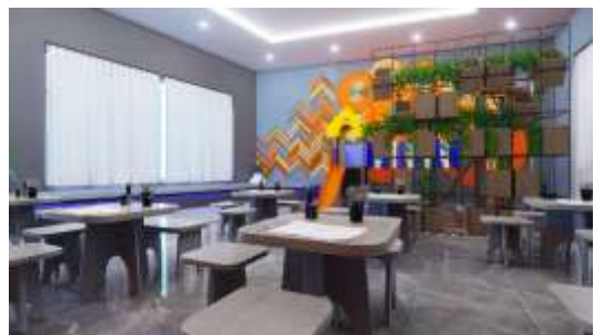
Gambar 26. Interior Ruang Terapi