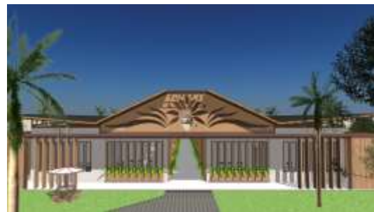
Gambar 16. Eksterior Gedung SMPLB