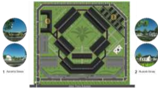
Gambar 7. Konsep Zoning Privat

Zona privat terletak di area paling belakang dengan pertimbangan ketenangan dan gangguan lainnya, area yang hanya diperuntukan oleh siswa yang tinggal diasrama dan guru yang tinggal dirumah dinas.