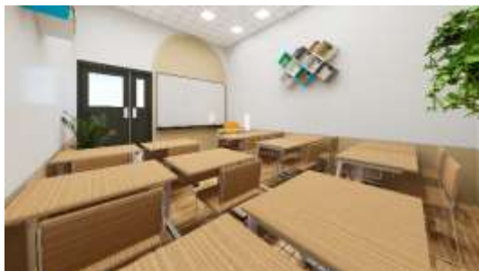
Gambar 13. Konsep Natural Analogus

Desain Sekolah Luar Biasa (SLB) C ini, menggunakan beberapa material alam berupa kayu, bata merah, lantai vinyl yang memberi kesan hangat dan alami dalam bangunan.