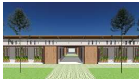
Gambar 18. Eksterior Gedung Pengelola