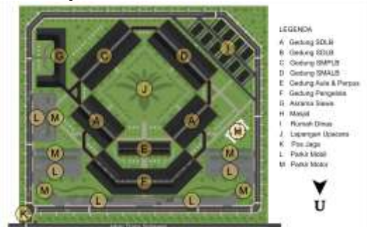
Gambar 10. Konsep Tata Massa Tapak

Konsep tata massa tapak menerapkan pola radial. Pola ini dipilih untuk memaksimalkan sirkulasi udara dalam tapak. Konsep tata massa bangunan pada tapak merupakan penataan yang diatur sesuai dengan zoning kebutuhan aktivitas didalamnya.