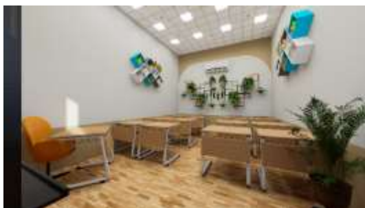
Gambar 23. Interior Ruang Kelas