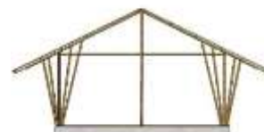
Gambar 10. Aula Serbaguna.