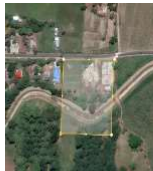
Gambar 2. Site Rencana.

Hasil rancangan Kawasan Islamic Center di Kecamatan Wonosari merupakan respon terhadap kebutuhan masyarakat akan sebuah pusat kegiatan keagamaan, Pendidikan, sosial, dan ekonomi yang integritas dalam suatu Kawasan. Rancangan ini dibuat berdasarkan hasil analisis tapak, observasi lapangan, dan wawancara dengan tokoh masyarakat setempat.