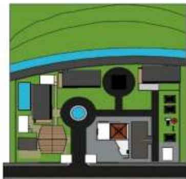
Gambar 4. Master Plan.

Area semi publik adalah area yang dapat diakses masyarakat namun memiliki Batasan atau hanya diperuntukan bagi kelompok tertentu, seperti santri, staf pengelola, atau peserta kegiatan tertentu.