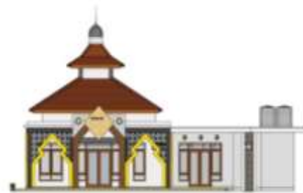
Gambar 9. Masjid.