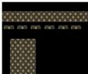
Gambar 15. Ka'bah.