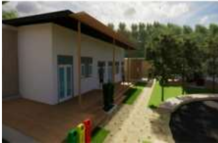
Gambar 13. Ruang Kelas.