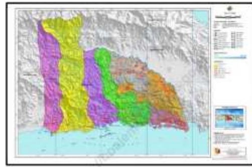
Gambar 1. Peta Kabupaten Boalemo.

Boalemo merupakan Kabupaten yang berada di Provinsi Gorontalo. Luas Kabupaten Boalemo pada tahun 2020 yakni 1.831,33 km. Perkembangan kepariwisataan di Kabupaten Boalemo mengalami peningkatan jika dilihat dari segi jumlah kunjungan wisatawan. Perkembangan kunjungan wisatawan mancanegara selama 5 (lima) tahun terakhir yaitu dari tahun 2011 sampai dengan 2016 terjadi peningkatan yang signifikan. (BPS Kabupaten Boalemo).