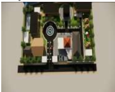
Gambar 7. Orientasi Bangunan.

Orientasi bangunan dalam Kawasan perencanaan dirancang menghadap ke arah jalan utama sebagai bentuk respon terhadap konteks tapak dan kemudahan aksesibilitas. Penghadapan bangunan ke jalan utama bertujuan untuk mempertegas citra Kawasan serta mempermudah identifikasi fungsi utama, khususnya pada bangunan masjid sebagai pusat kegiatan. Selain itu, orientasi juga mendukung pencapaian visual dan pergerakan pengguna dari arah luar menuju Kawasan.