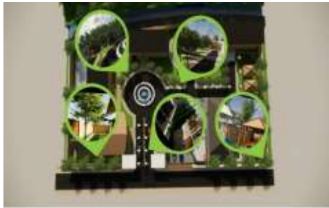
Gambar 6. Vegetasi, Kebisingan, Klimatologi.

Tingkat kebisingan di sekitar Lokasi cenderung rendah hingga sedang, terutama berasal dari aktivitas jalan lingkungan dan sesekali kendaraan bermotor.