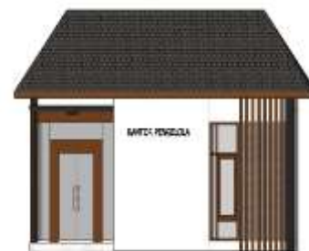
Gambar 11. Kantor Pengelola.