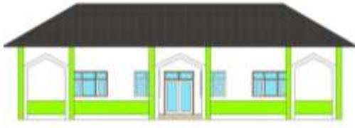
Gambar 12. Ruang Service.