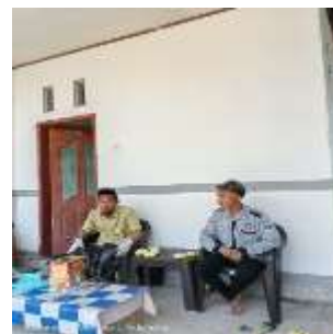
Gambar 3. Wawancara.

Hasil rancangan Kawasan Islamic Center di Kecamatan Wonosari merupakan respon terhadap kebutuhan masyarakat akan sebuah pusat kegiatan keagamaan, Pendidikan, sosial, dan ekonomi yang integritas dalam suatu Kawasan. Rancangan ini dibuat berdasarkan hasil analisis tapak, observasi lapangan, dan wawancara dengan tokoh masyarakat setempat.