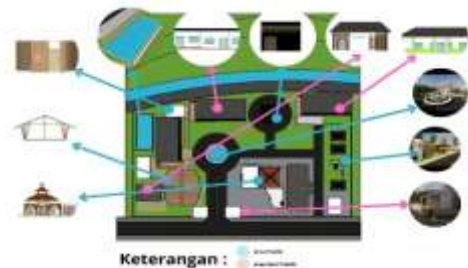
Gambar 18. Hasil Penerapan Zoning Ruang Kawasan.

Penerapan zoning dalam Kawasan perancangan bertujuan untuk mengatur pembagian fungsi ruang secara optimal, sehingga setiap aktivitas memiliki tempat yang sesuai dan tidak saling mengganggu. Dalam perancangan Kawasan Islamic Center di Kecamatan Wonosari, zoning Kawasan dibagi berdasarkan tingkat aksesibilitas dan fungsi utama ruang. Pembagian zona terdiri dari zona publik dan zona semi publik.