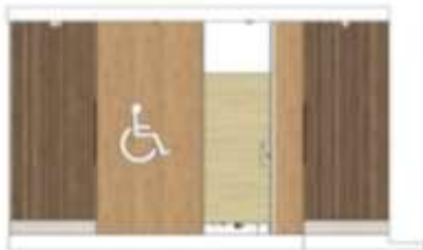
Gambar 14. Wc Umum.