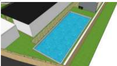
Gambar 16. Kolam Ikan.