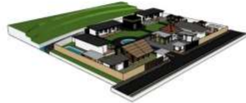
Gambar 8. Perspektif Site.

Perspektif site menggambarkan visualisasi keseluruhan Kawasan dari sudut pandang manusia untuk menunjukkan hubungan antar elemen ruang dalam satu kesatuan desain. Pada perancangan Kawasan Islamic Center ini, perspektif site memperlihatkan integrasi antara zona publik dan semi publik. Masjid sebagai pusat orientasi Kawasan diletak pada posisi sentral dan menonjol secara visual.