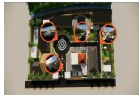
Gambar 5. Sirkulasi & Aksesibilitas.

Rancangan aksebilitas ini memperlihatkan prinsip inklusivitas, efisiensi, dan keamanan dalam mobilitas pengguna di seluruh Kawasan.