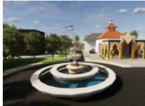
Gambar 17. Vocal Point.