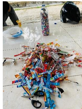
Gambar 2. Sampah plastik yang sudah digunting

Eksperimen langsung dilakukan dengan menerapkan proses pembuatan ecobrick menggunakan limbah anorganik kering, seperti plastik dan kertas, untuk memastikan keefektifan langkah-langkah yang diterapkan. Analisis data dilakukan secara kualitatif dengan menafsirkan hasil observasi, wawancara, dan eksperimen untuk menjelaskan proses, tantangan, dan manfaat dari pemanfaatan limbah menjadi ecobrick .