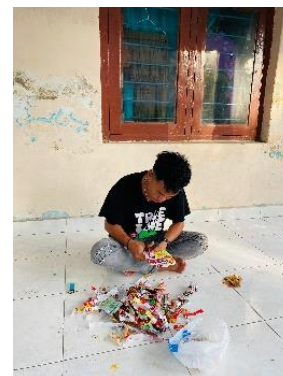
Gambar 3. Sampah yang digunting dan akan dimasukkan kedalam botol

Penelitian ini disusun melalui tahapan identifikasi masalah, perencanaan eksperimen, pelaksanaan eksperimen, evaluasi hasil, serta penyusunan kesimpulan dan rekomendasi.