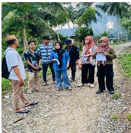
Gambar 1. Survei Lokasi Pengambilan Sampel dan Wawancara

Penelitian ini dilakukan didesa Limbato, Kec. Tilamuta, Kab. Boalemo, Gorontalo. Metode penelitian ini menggunakan pendekatan deskriptif kualitatif yang bertujuan untuk memahami proses pemanfaatan limbah anorganik kering menjadi ecobrick . Data dikumpulkan melalui observasi, wawancara, eksperimen langsung, dan studi literatur. Dalam penelitian ini ada beberapa pendekatan kualitatif yang digunakan yaitu dengan melakukan beberapa cara antar lain (survei Lapangan) untuk mengetahui seberapa banyak limbah padat di Desa Limbato yang tidak diperhatikan oleh masyarakat dan berdampak negatif pada lingkungan. Observasi dilakukan untuk mengidentifikasi jenis limbah anorganik kering yang tersedia serta memahami langkah-langkah pembuatan ecobrick , termasuk proses pemilahan, pemadatan, dan pengemasan limbah ke dalam botol plastik.